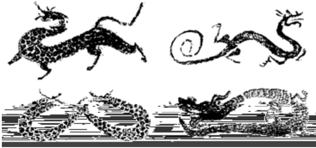
（圖四）《山海經圖》卷之四，張江生繪，上海人民美術出版社，1997年。

漢畫中的龍，可大別為獸形（左上）、蜥形（右上）、蛇形（左下）、鱷形（右下）等4類。