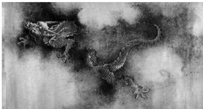
南宋 陳容 九龍圖卷（局部），大約從唐代起，龍的造形已基本固定。

既然龍是種想像的動物，那麼牠的行為當然也出於想像。《說文》：「龍，鱗蟲之長，能幽能明，能細能巨，能短能長，春分