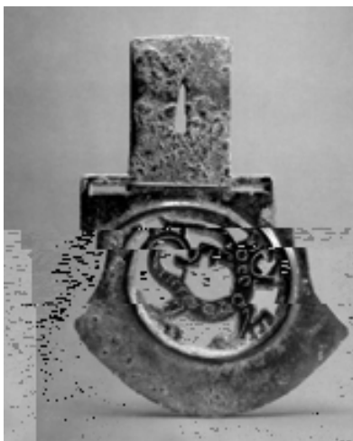
商晚期 透雕龍紋鉞。因配合器型，龍形紋飾作圓形。

等，不論半具象或變形，莫不巨首張口、頭上有角，有時尚有鱗片。戰國時發展出鑲嵌工藝，在青銅上鑲嵌紅銅或銀、金紋飾，戰國早期的「鑲嵌龍紋扁壺」，龍紋已較前複雜。比對商、西周、春秋、戰國青銅器的龍形紋飾，似乎有朝向複雜化演變的趨勢。