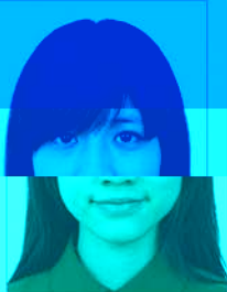
头发遮蔽 眉毛、眼睛或耳朵