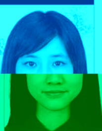
相片损坏 或有污渍