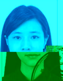
印章或其他 物品遮挡人像