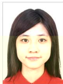
对比度太强 (面部高光)