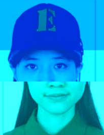
戴帽及发饰 遮挡面部或双耳