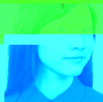
头部侧向一边未正视镜