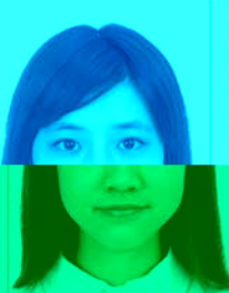
服饰颜色 与背景接近